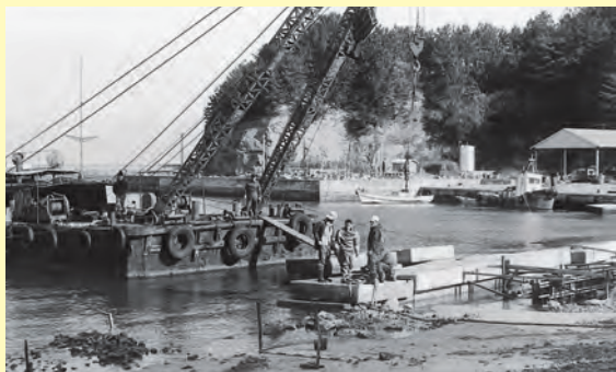
第6次漁港整備計画で整備中の黒松漁港船揚場▲