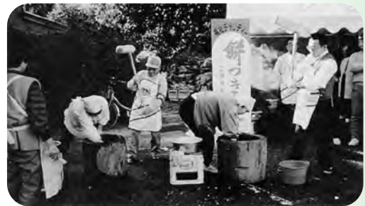
▲福祉チャリティー。社会福祉センターへもちつきの売上げ金の一部を贈る。