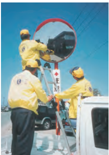
カープミラーの清掃▲