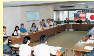
▲この年から始まった「江津市・米国コロナ市交換学生交流」