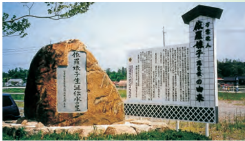
▲万葉歌人 依羅娘子 案内看板 1998.7