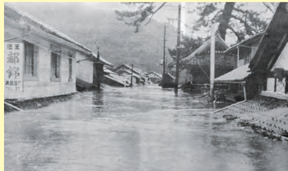
▲豪雨で2階まで水に浸った松川地区