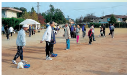
▲第1回江津LC杯ベタंक大会