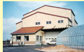
▲完成した江津市育苗乾燥調整施設