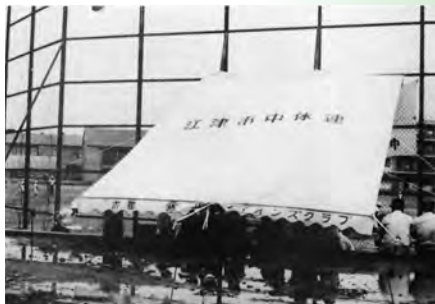
▲県中学野球大会に天幕贈る