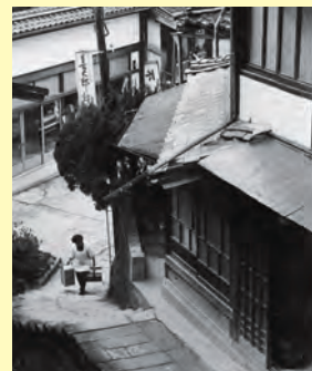
昭和40年半ばころの有福温泉街▲