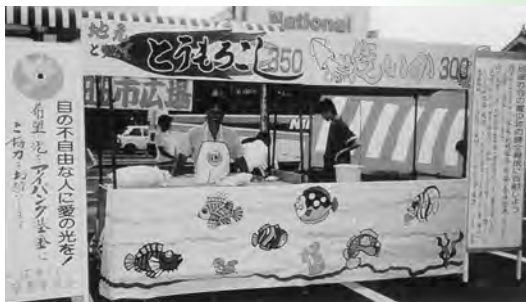
▲グリーンモール土曜市にて(収益事業・献眼委員会)