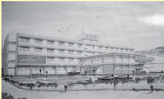
▲増築工事後の済生会江津病院