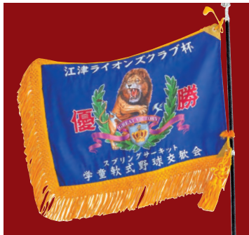
江津ライオンズクラブ杯 学童軟式野球交歓会 (4月2・3日開催予定)