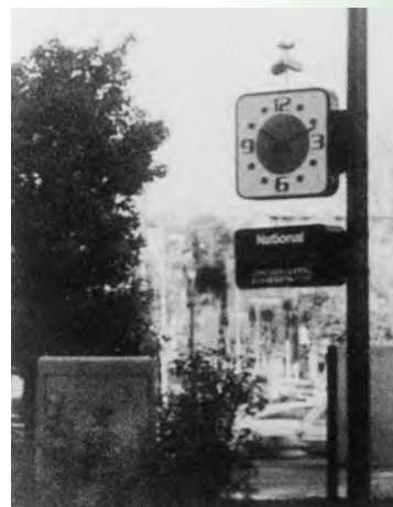
▲太陽電池時計 寄贈 江津中央公園