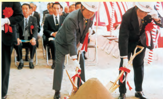
江津バイパス着工記念式▲