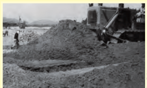
▲江浜工業が青山洋工業団地に進出