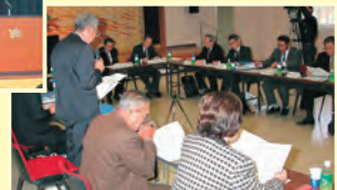
▲11月に開かれた桜江町との法定合併協議会合併方式を正式決定した(島根県石見地域地場産業振興センター)