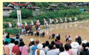
▲5月は田植え時期、川平町では「花田植え」が復活、披露された

▲日露戦争時に和木沖で沈んだロシア船イルティッシュ号の乗組員を救助したことから始まった「ロシア祭」が20年ぶりに復活。海岸にある慰霊碑に献花するソビエト連邦大使館員