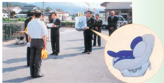
▲乳幼児を交通事故から守るため、市民より要望の多いチャイルドシートを、交通安全週間に合わせて江津市交通安全協会へ贈呈する。(30万円)