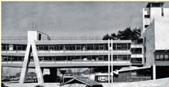
▲全市挙げてお祝い!待ちに待った新市庁舎の落成式が3月23日に来賓多数が臨席されて挙行。その後新装なった市民会館で海上自衛隊音楽隊も参加して祝賀会が催された。