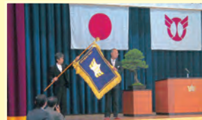
▲青陵中学校新校旗の授与