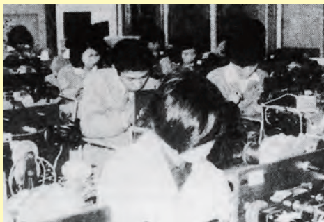
▲創業を開始した松江松下電器江津工場の従業員はUターン組が主体