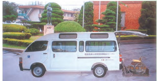
▲本年度の活動目標「福祉と環境」の一環として、社会復帰に向けて頑張っている子供たちを支援するため、リフト付き送迎車を西部島根心身障害医療福祉センターへ贈呈する。(370万円)