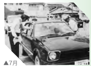
▲7月 シートベルトを着けよう (保健安全委員会)