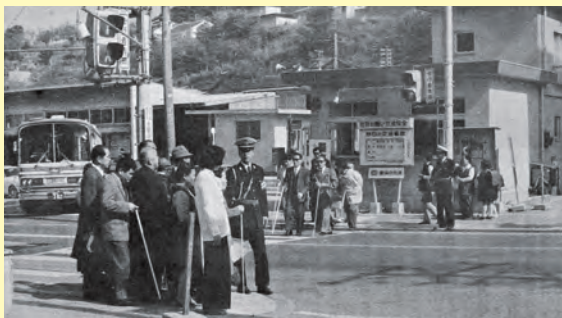
▲江津警察署員の指導で視力障害者用信号機で国道を横断する視覚に障害のある人たち