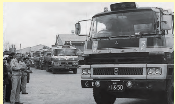
瓦を満載し初荷が出発▲