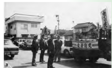
▲秋の交通安全週間に参加