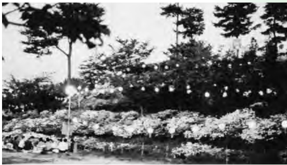
▲江津つつじ祭 丸子山公園