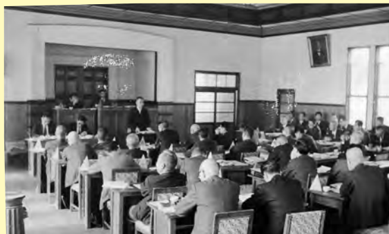
▲議会での千代延市長の施政方針演説