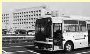
バスベイも完成し、利便性も向上▲