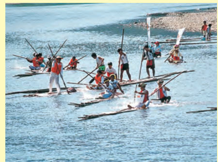
▲江の川祭の行事の一つ「いかだ下り競争大会」