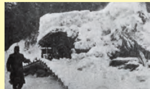
▲積雪のため倒壊した家屋