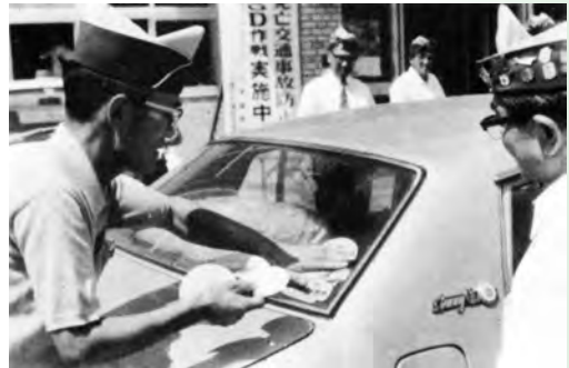
▲ステッカーはりの会員