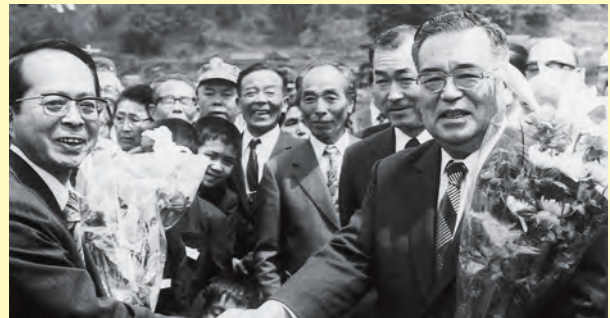
▲三江線(江津-三次間)のレールは4月22日、全線つながった。完工式で握手する島根県の伊達慎一郎知事(右)と広島県の宮沢弘知事