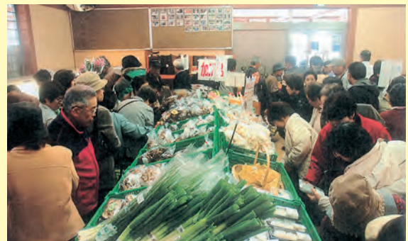
地元の新鮮野菜はいかがですか▲