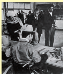
▲丸八島根業所リハビリテーション施設を視察される天皇・皇后両陛下