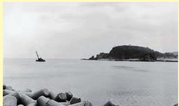
▲江の川河口離岸堤の建設が始まる▲