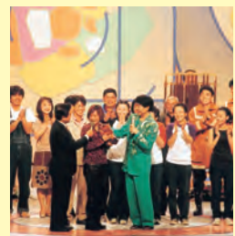
▲市制施行45周年記念事業として行われたNHKの公開番組「のど自慢」