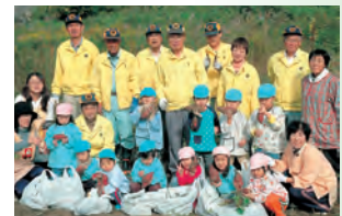
保育園児と芋掘り