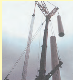
▲風車を組み立てている様子▲