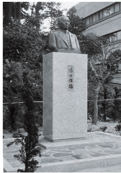
▲嶋田俊雄氏の胸像