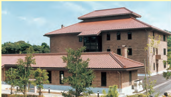
完成した島根県石央地域地場産業振興センター▲