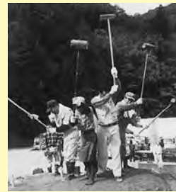
窯の屋根を一齐に叩く様子▲