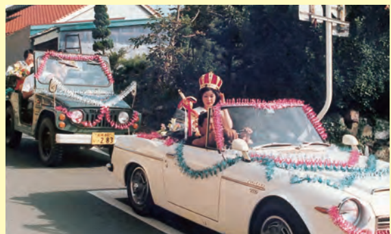
ミスごうつ祭りコンテスト優勝者の市内パレード▲