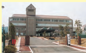
▲山陰初の工科系高等教育機関とし て開校した島根職業能力開発短期 大学校