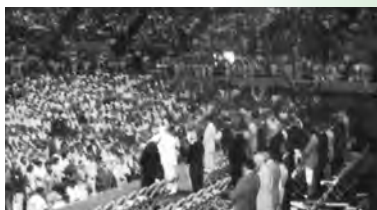
▲プレスデルセンターで行なわれた開会式には6万人のライオンとライオネスが会場をうめつくした