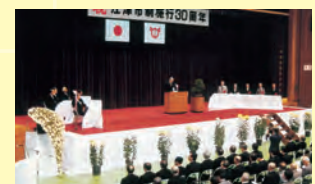
▲11月1日、江津市民体育館で盛大に市制施行30周年記念式典を挙げる