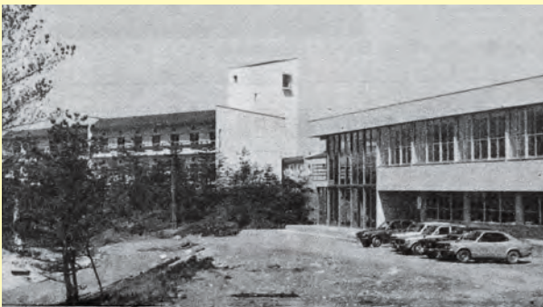
開所した県立少年自然の家▲