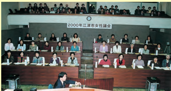
▲市政や議会への関心を深めるとともに、女性の感性を魅力ある豊かなまちづくりに生かしてもらおうと、市と江津市女性ネットワークの主催で模擬市議会「2000年江津市女性議会」が開かれた