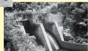
▲畑地かんがい用水用跡市ダム