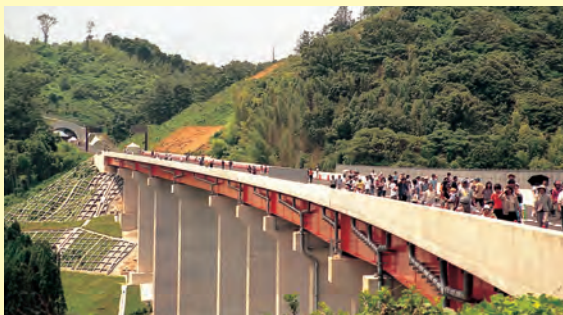
▲江津道路開通に先立ち六月に行われたプレイベントで、市民など1200人が敬川橋を渡り初め