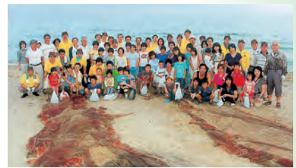
▲地域の子供達と清掃奉仕並びに地引網