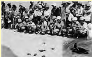
▲みんなで声援を送りました