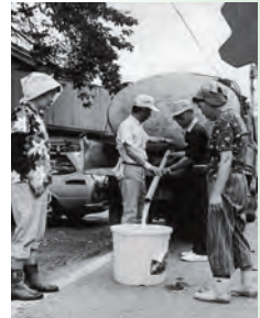
▲被災後、給水車がまっ先に現地へ飛んだ(昭和58年豪雨災害、川平地区で)