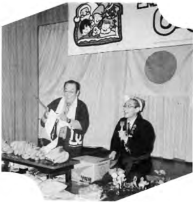
▲募金活動のためバナナのたたき売り