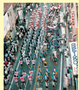
▲市制施行40周年を迎え、例 年になく盛り上がりを見せた 江の川祭