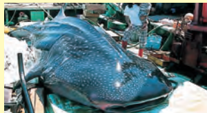
▲8月7日、渡津町の江津漁協に体長6.4メートル、重さ約6トンのジンベイザメが水揚げされた

▲日露戦争時に和木沖で沈んだロシア船イルティッシュ号の乗組員を救助したことから始まった「ロシア祭」が20年ぶりに復活。海岸にある慰霊碑に献花するソビエト連邦大使館員