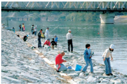
▲10月15日(河川清掃活動&親子ハゼ釣大会)