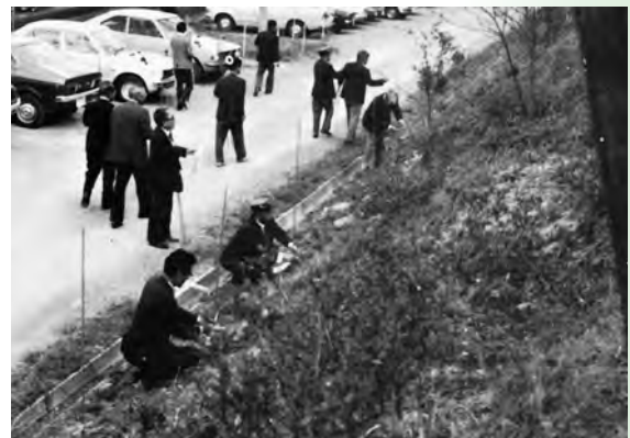
▲公園清そう 苗木植樹