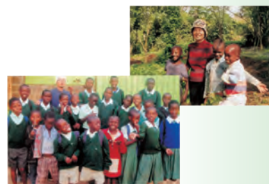
▲「東アフリカ子供救援センター」支援