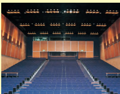
▲市の新しい「文化と福祉の拠点」となる江津市総合市民センター