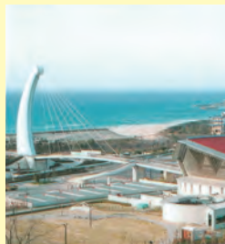
▲完成間近いアクアス