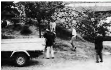
▲早朝、全員参加して植木の手入れ