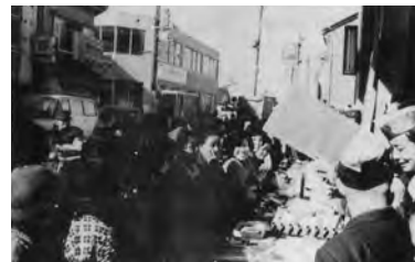
▲どうです、この人出。チャリティショーは大人気でした