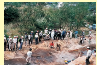
波子遺跡を再調査▲