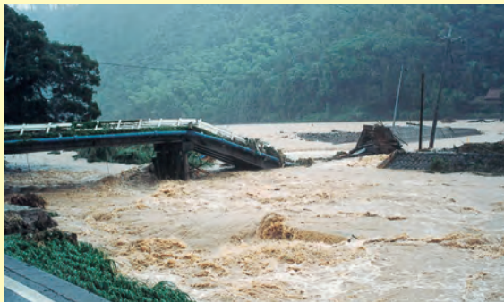
7月豪雨で濁流に流された三平橋(敬川町)▲