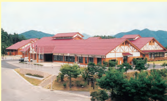
▲県立少年自然の家が新装オープン