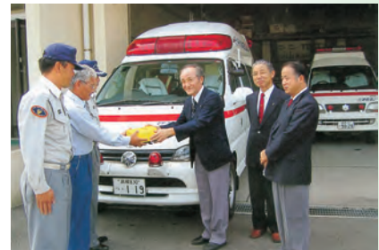
▲ハートスタートFR2 AED 寄贈