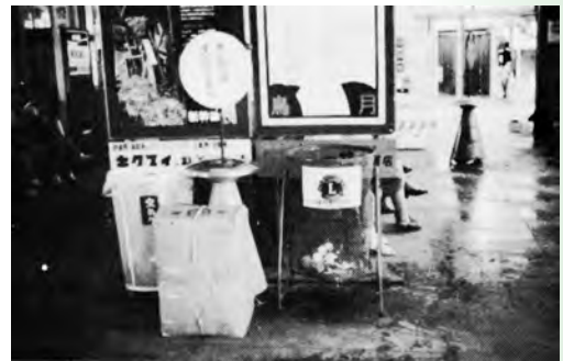
▲江津駅のちりかご