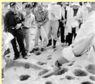
▲石見で最大の集落跡、高津遺跡