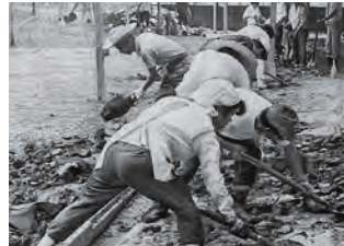
▲7月豪雨で、松平中学校に救援奉仕する市内の小・中学校先生たち