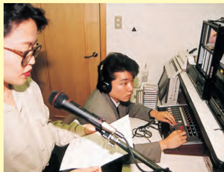
▲オフワーク通信サービスの本放送が始まった