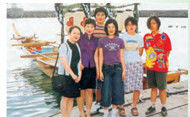
▲江の川高校留学生及び国際交流員6名受け入れ(ホームステイ)