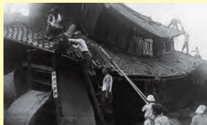
▲7月豪雨で基礎が洗われて傾いた新川沿いの民家