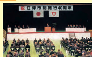
▲市制施行40周年記念式典