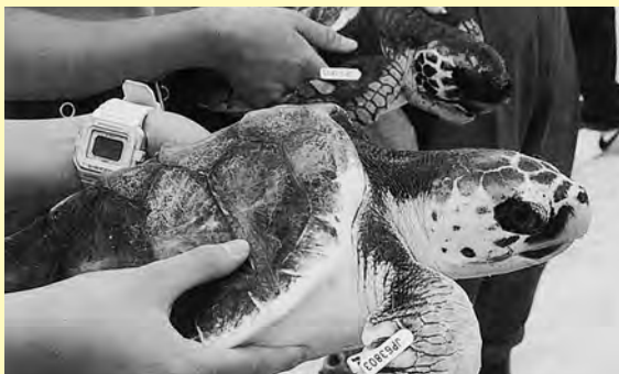
こんなに大きくなりました▲