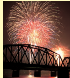
▲華やかに第一回「江の川祭」