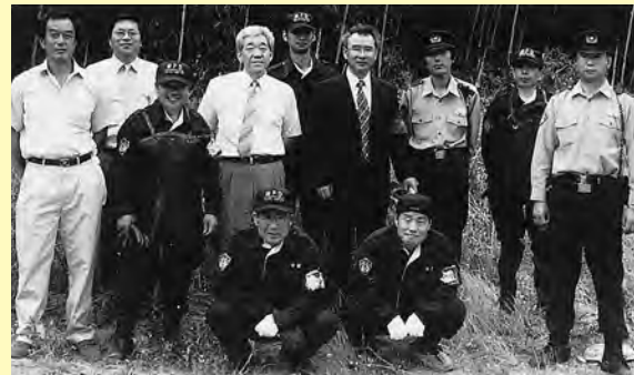
江津市オールスターズ(エキストラ)のみなさん▲