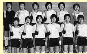
▲全国大会でも力を合わせて頑張るぞ!