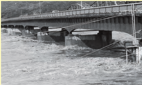
7月豪雨で橋脚を洗う江の川の濁流▲