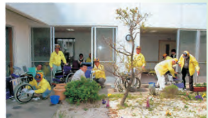
▲11月 特別養護老人ホーム白寿園にて車椅子清掃奉仕