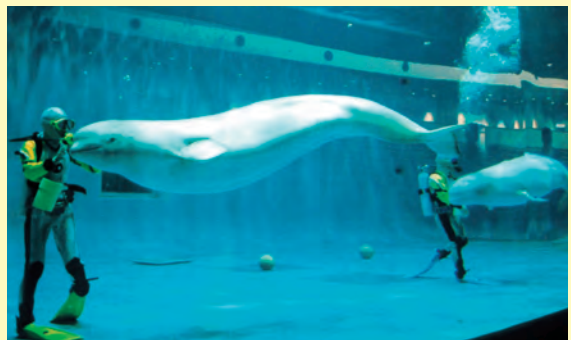
▲アクアスオープン行事▲