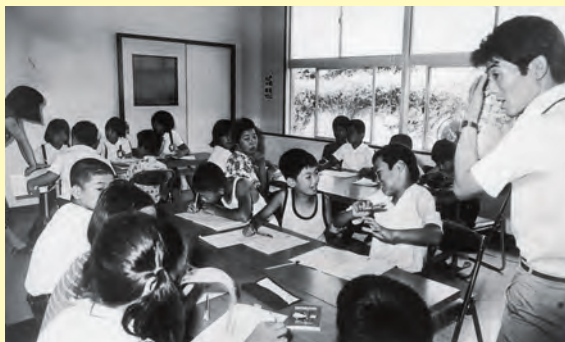
市図書館に子ども読書サークル誕生▲