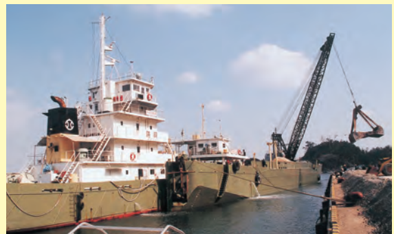
▲江津港に3,000トン級の船が初入港