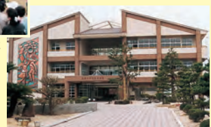
▲パソコン教室など整備された江東中学校