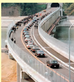
▲念願だった国道9号バイパス がついに開通。鼓笛隊を先 頭に自動車パレードが進む 開通式典