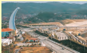
▲江津市と浜田市にまたがる建設中の県立石見海浜公園Dゾーンでは、県内外の交流人口拡大を狙い、県が遊空間づくり事業を進めた