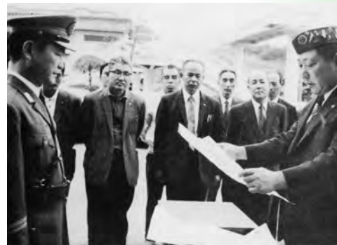
▲交通安全教室用に信号灯贈る

江津市外7町村消防組合江津消防署へ 消防広報車 1台贈呈 江津警察署へ 交通指導車 1台贈呈