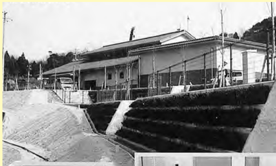
はし浄化センター▲