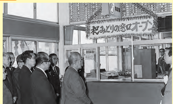
12月に江津駅の「みどりの窓口」オープン▲