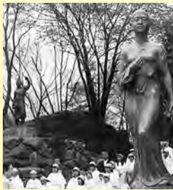
人麻呂像と依羅娘子像▲