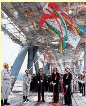
▲新江川橋が両岸につながり、締結式が行われた