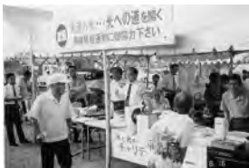
▲「江の川祭」のチャリティーバザー