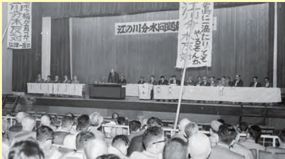
▲江の川流域開発計画にからみ浮上した広島県への分水問題の報告会には、「分水反対」ののぼりが持ち込まれた(江津市民会館)