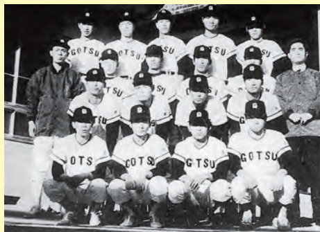
春夏連続で甲子園出場した江津工高野球部▲