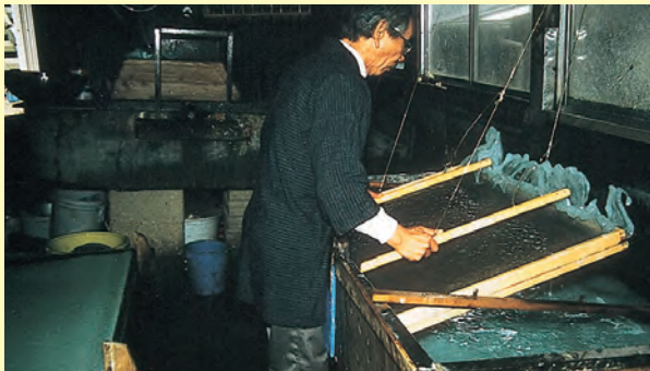
島根県石央地域地場産業振興センターでの石見半紙づくり▲