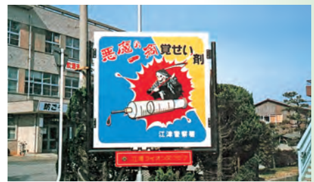
▲「悪魔の一滴、覚せい剤」