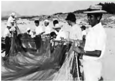
▲地域の方々と地引網