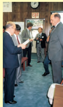
◀コロナ市長(左)にメッセージを伝える 交流親善訪問団