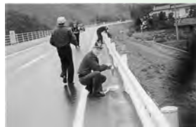
▲市内松川町国道261号線ガードレールに夜間の交通安全の為、反射テープ150枚を貼る