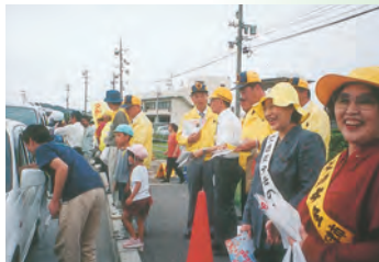
▲秋の交通安全テント村