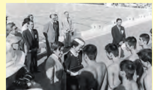
▲くにびき国体・水球競技の選手達を激励される皇太子ご夫妻