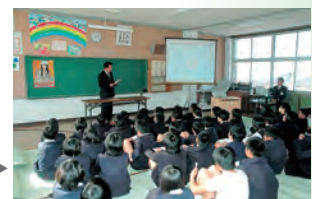
薬物乱用 防止教室