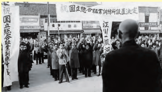
▲江川一級河川指定と国立総合職業訓練所の設置決定を、東京から帰江した市長は石見江津駅前市民に報告(昭和41年1月4日)