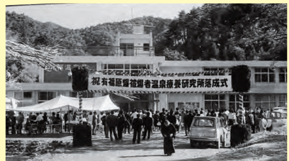
▲開設された原爆被爆者温泉療養研究所「有福温泉荘」