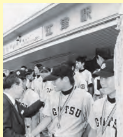
▲中国中学校野球大会で優勝した江津中学校野球部