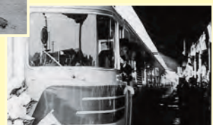
▲石見江津駅に停車することになった特急やくも

▲7月23日の水害で江川の主要な橋を次々と破壊した中国電力浜原ダムの鉄製ブイは上江川橋の橋脚に激突して沈んだが、8月3日、10日ぶりに撤去された