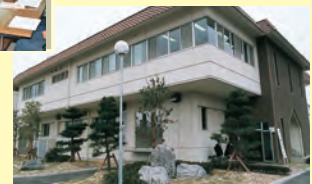
▲新し尿処理場・江津浄化センターが完成