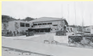
▲くにびき国体のハンドボール会場となる江津市民体育館も12月に完成