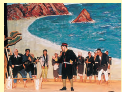
▲イルティッシュ号乗組員救援90周年記念行事で熱演する市民劇団