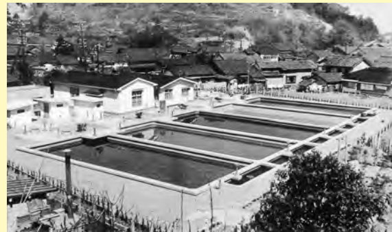
▲泉町の上水道水源地