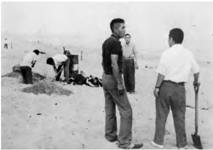
▲波子海水浴場早朝清掃