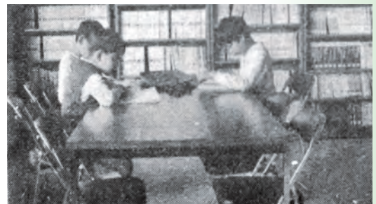
▲完成した市図書館の子ども室で本を閲覧する子供たち