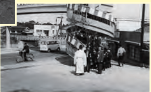
▲市内横断歩道橋第1号となった郷田横断歩道橋