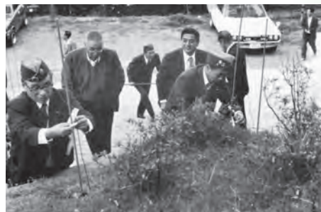
▲ライオンズ奉仕デー