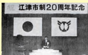
▲盛大に行われた市制施行20周年記念式典