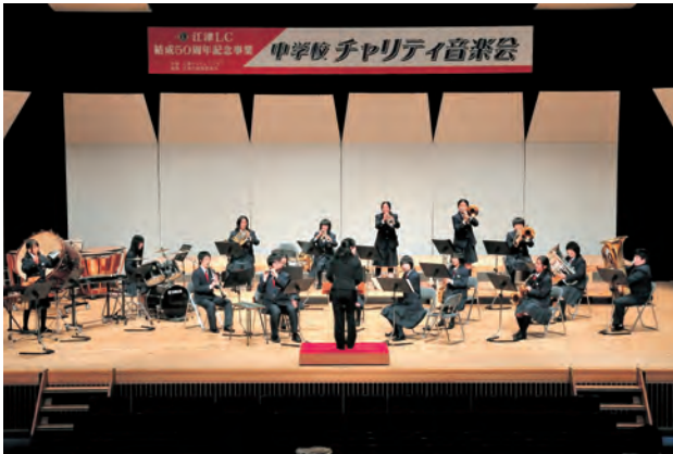
中学校チャリティー音楽会