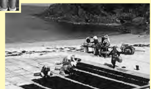
▲黒松特産ワカメの天日干し▲