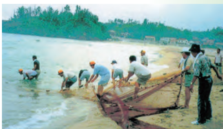
▲黒松海岸にて地引網、海岸清掃を行う。