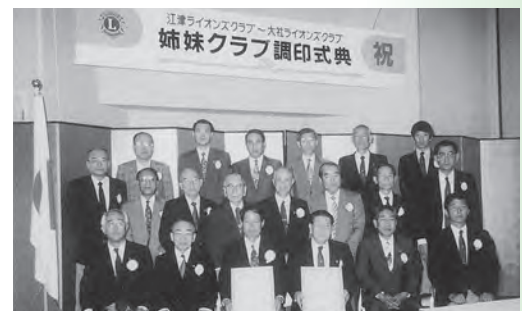
▲姉妹クラブ調印式典記念