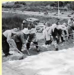
▲翌年開催のくにびき国体を花で飾ろうと、嘉久志町の老人クラブ健老会と連合自治会は「花いっぱい運動」に参加、花壇づくりに励んだ