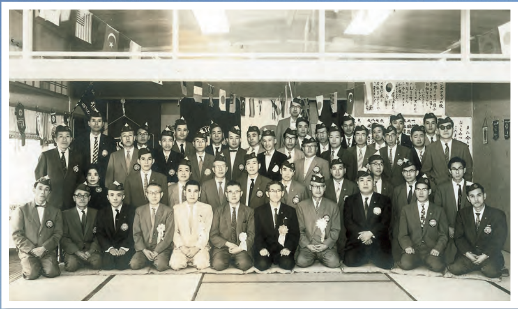
1960年 江津ライオンズクラブ結成