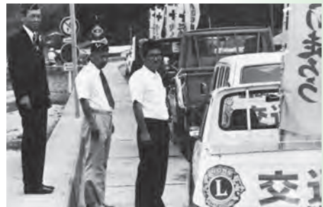
▲秋の交通安全運動