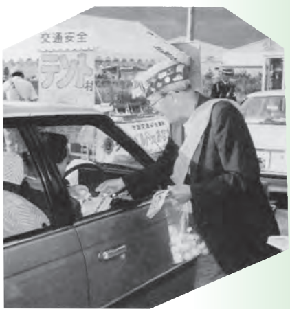
▲交通安全運動テント村で…