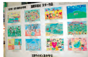
平和ポスター 作品展示