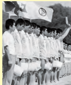
▲江津工業高校と江津高校から選抜された水球島根県チームは見事、初優勝を飾った