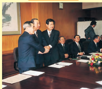
▲江津工業団地へ企業進出